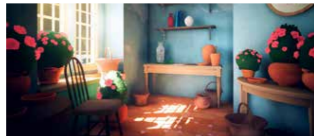
Space Prison // Windows, PS5, Xbox Series // ab 18 Jahren

Beschaulichkeit & Entschleunigung - mit diesen Eigenschaften hebt sich dieses Spiel von aktuellen Videospiele ab. Das Puzzle-Adventure des britischen Entwicklers Balloon Studios ist im England des viktorianischen Zeitalters angesiedelt, allerdings bekommt es der Spieler nicht mit Monstern und Schöpfungen wahnsinniger & größenwahnsinniger Wissenschaftler zu tun. Er schlüpft vielmehr in die Rolle einer - so einfach & bescheiden kann ein modernes Computerspiel sein - Gärtnerin. Arabella Greene ist Herrscherin über Botany Manor. Das ist ein herrschaftlich anmutenden Anwesen und Zuhause einer üppigen Garten- & Pflanzenwelt. In diese Welt gilt es für Arabella und damit für den Spieler am Leben zu erhalten. Dazu müssen Samen gesucht, gefunden und eingepflanzt werden. Erschwerend kommt hinzu: Auch Pflanzen sind wählerisch, jede Sorte bevorzugt ihren spezifischen Lebensraum, dies zu finden gehört zu den Aufgaben des Spiels. Nur gut, dass sich der Spieler botanisches Wissen aneignen kann, durch Zeitungen, Briefen, Gemälden und Postkarten, die im Spiel verstreut sind.